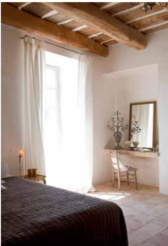
Foto links: in de gastenkamers werd een plafond gemaakt van kastanjabalken en kastanjeplanken, gips en deels plâtre de Paris. Dat is een 'oude' gipsvariant. De wandisolatie gebeurde met kurk en gips. Foto midden: de vloeren in de gastenkamers bestaan uit een kalkvloer, houten vloeren en parefeuilles.