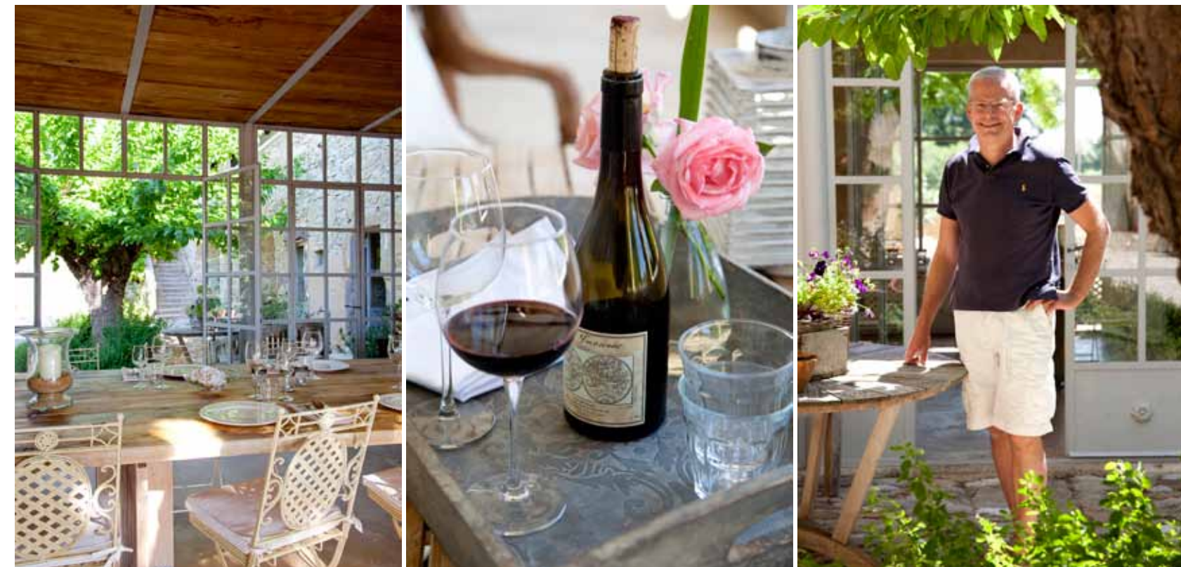
Foto links: waar ooit een oude schuur stond, prijkt nu de orangerie, met een vloer van luchtkalk en een kastanjehouten plafond geïsoleerd met twintig centimeter kurk.

“Stilaan kregen we ook een beeld van hoe het gebouw er in de toekomst zou gaan uitzien. De oude paardenstal werd een keuken: die is op de begane grond en grenst aan de grote binnenplaats, wat handig is als je buiten eet. De schuur op de binnenplaats werd een orangerie. En daaromheen ontstonden de zitkamer, eetkamer, hal,