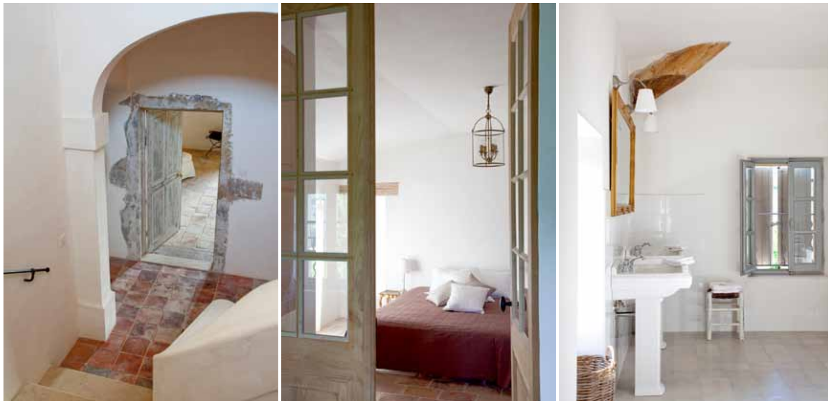
Foto rechts: de badkamervloer bestaat uit handgemaakte cementtegels, de muurtegels zijn van Villeroy & Boch en carreaux de ciment. Het sanitair is van Villeroy & Boch.

Een ander criterium bij de materiaalkeuze was het verouderingsproces. Robert: “We kozen voor materialen die bij het verouderen ‘rijker’ worden en meer gaan leven, en voor materialen die niet doorslijten. Het werkblad in de keuken is daar een mooi voorbeeld van: het bestaat uit een stuk natuursteen van twee ton.” Ook qua bouwtechnieken ging het koppel resoluut voor de oude, authentieke werkwijze: “Zo hebben we onze luiken bijvoorbeeld vastgezet door het gieten van lood, en niet met ijzeren pinnen die onderhevig zijn aan corrosie. Ons metselwerk maakten we oud door grootkorrelig zand te gebruiken en daar zelfge-